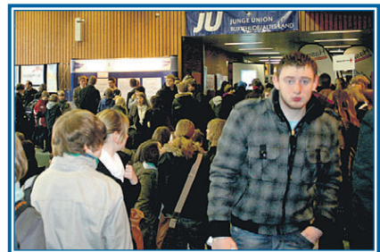
Die Aula des Schulzentrums Süd wird zum Messezentrum: Über 1000 Schüler informieren sich an über 50 Ständen

und Interesse zeigen und vielleicht sogar dort schon ihre Bewerbungsmappe abgeben, haben beste Voraussetzungen, den gewünschten Ausbildungsplatz zu bekommen.