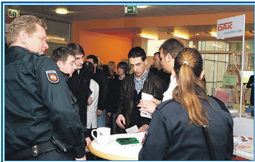
Auf der Buxtehuder Ausbildungsmesse können Schüler erste Kontakte zu den Unternehmen knüpfen

Rettungsassistent und viele mehr. Zusätzlich werden von Anglistik und Betriebswirtschaftslehre über Gebäudeenergie-technik und Lebensmittelwissenschaft bis hin zu Physik, Sport und Wirtschaftswissenschaft verschiedenste Studiengänge vorgestellt.